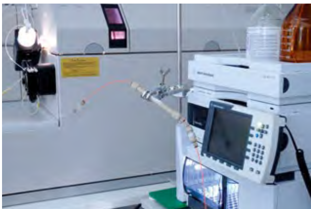
Kopplung der LC mit der ICP-MS zur Element-Spezies-Bestimmung

Sowohl die essentiellen als auch die toxischen Eigenschaften der Elemente hängen meistens von ihrer chemischen Bindungsform ab bzw. in welcher Spezies diese Elemente vorliegen. So haben z.B. sechswertige Chromverbindungen eine deutlich höhere Toxizität als die dreiwertigen Chrom-Spezies. Im Falle des Arsens sind die anorganischen Spezies eindeutig kanzerogen und stark toxisch verglichen mit dem viel weniger toxischen Arsenobetain. Gerade diese organisch gebundene Spezies kann jedoch nach Fischverzehr den Gesamt-Arsen-Gehalt im Urin signifikant erhöhen somit eine Intoxikation mit Arsen vortäuschen. In so einem Fall ist zur klinischen Diagnostik daher die quantitative Differenzierung der einzelnen Arsen-Spezies im Urin notwendig.